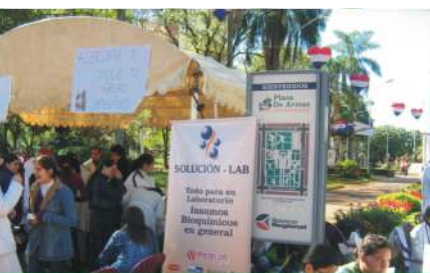
CEMUNI, Medicina Solidaria Plaza de Armas

El viernes 4 de Setiembre los miembros de la Comisión Directiva del Centro de Estudiantes de la Facultad de Medicina de la Universidad Nacional de Itapúa (CEMUNI), han donado a la Sala de Maternidad del Hospital Regional de Encarnación instrumentales e insumos médicos por valor de 2 millones de Gs., por medio de una actividad desarrollada en la Comunidad que se denominó "MEDICINA SOLIDARIA".