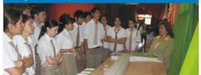
Expocarreras de Humanidades Pág.15