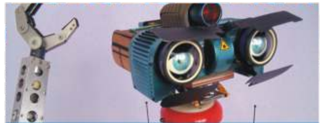
Conferencia y Seminario "Robótica Industrial" Pág.11