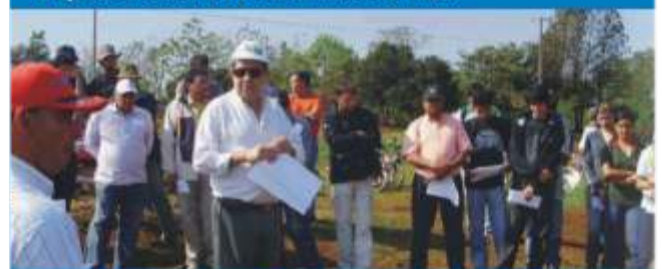
Día de Campo sobre Trigo en Sede de Natalio Pág.11