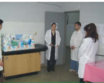
CEMUNI, Donación Sala Maternidad HRE.