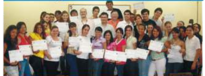
Programa de Capacitación Laboral de FaCEA Pág.13